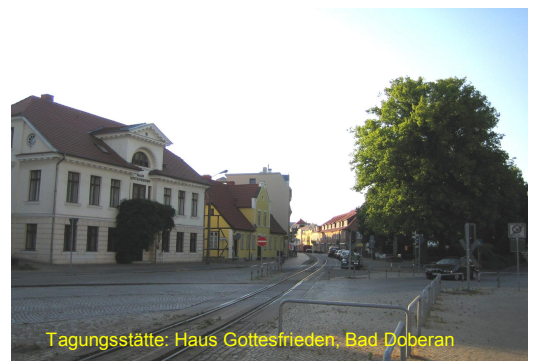
Tagungsstätte: Haus Gottesfrieden, Bad Doberan

Henry Tesch Minister für Bildung, Wissenschaft und Kultur des Landes Mecklenburg-Vorpommern