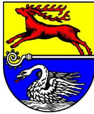
Stadt Bad Doberan