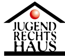
Bundesverband der Jugendrechtshäuser Deutschland e.V.